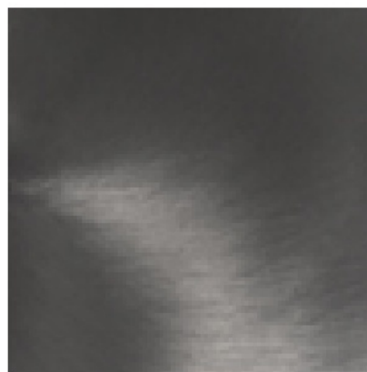
NNS matt black nickel